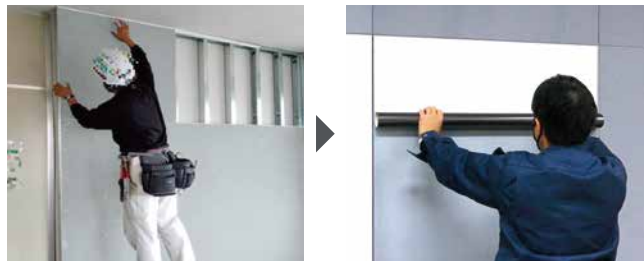
タイガーFeボードを施工してマグ不燃 ® クロス・キッチンシートを張るだけ