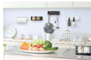
マグアイテムを壁に取りつける際におおよその目見当だけで、水平かつ、平行にも配置できます。

※「タイガーFeボード」は、吉野石膏株式会社の登録商標です。※製品写真、イラストは実物と異なることがあります。なおデザイン・仕様は変更することがあります。